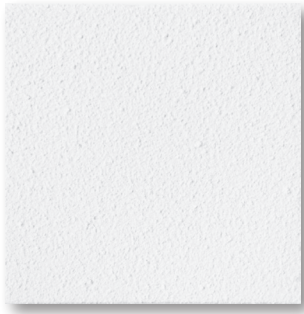
Durable and Versatile Spray-on Coating

The only choice when durability matters most